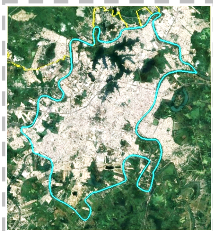
Imagen 3. Área metropolitana de Villahermosa al interior de “La Isla”, foto satelital 2024 Google Earth

presiones por la invasión y relleno de sus riberas; los remanentes principales son: “Las Ilusiones”, “El Negro”, “El Espejo”, “La Pólvara” y otras lagunas sin denominación.