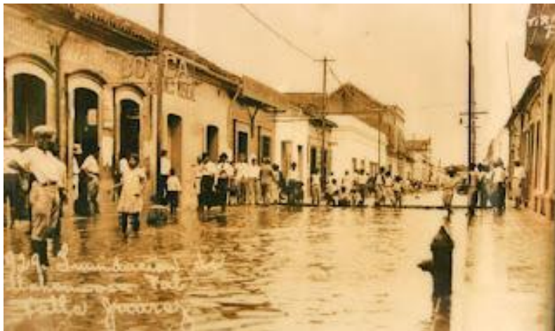
Imagen 1. Inundación de 1929

En esa época, Villahermosa había crecido hacia otras partes altas, como la loma de “Los Pérez”, que corresponde a la actual calle Ignacio Zaragoza y el camino real a Atasta y Tamulté, siendo este el tramo histórico de la Av. 27 de Febrero.