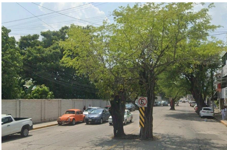
Imagen 4. Antiguo vaso de la laguna “El Negro”, hoy calle “Lamberto Castellanos”; aprox. 4.0 m.s.n.m. (cuatro metros sobre el nivel medio del mar.

Otra obra vial que invadió un cuerpo de agua es el Paseo Tabasco, que seccionó la laguna “La Pólvara”, misma que posteriormente fue drenada y ocupada en la mayor parte de su superficie; el mismo destino sufrió el vaso de la colonia Guayabal, que fue partido por el Paseo Usumacinta y por el Periférico Carlos Pellicer Cámara; actualmente queda una pequeña porción, frente a las instalaciones de Seguridad Pública, donde existe una unidad deportiva; la parte ubicada al noreste, fue rellenada para construir las tiendas Aurrerá y Sam’s.