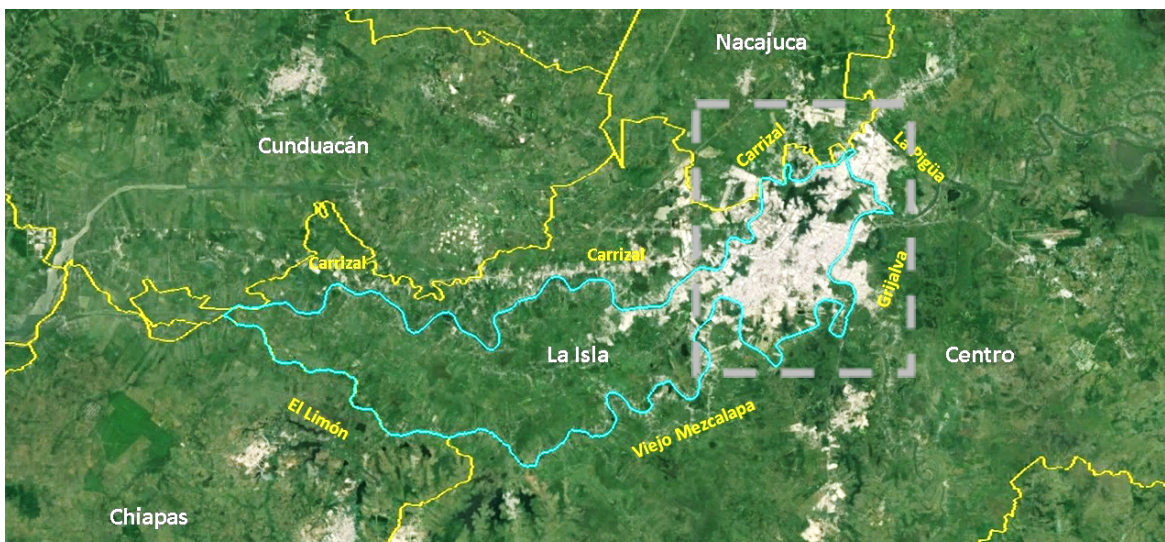
Imagen 2. La región “La Isla”, foto satelital 2024 Google Earth

La mayor parte de Villahermosa, se localiza en el vértice noreste de la región denominada “La Isla”, que tiene una superficie aproximada de 168 km 2 . Durante la construcción del sistema de presas del Alto Grijalva, se puso en marcha el “Proyecto Integral de la Isla”, a cargo de la Comisión del Río Grijalva, ya que la región recibiría un fuerte impacto por el desfogue de las presas. En 2013, se puso en marcha la obra de control hidráulico nombrada “ Compuerta del Macayo ”, ubicada en el extremo oeste de “La Isla”, que debe su denominación a que está delimitada en su totalidad por diversos cauces fluviales.